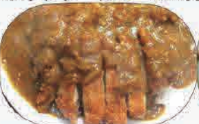
カレーとんかつ 600円