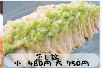
蒸し鶏 小 480円 大 750円