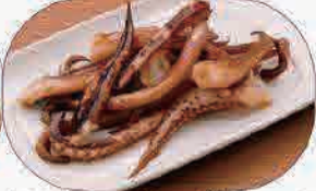
イカゲソのバター焼き490円