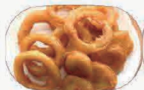
オニオンリング揚げ380円