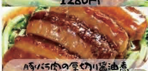
豚バラ肉の厚切り醤油煮 1150円