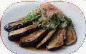
ナス焼きポン酢490円