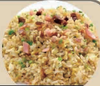
特製タンメン+半炒飯セット 特製味噌タンメン+半炒飯セット