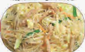
焼きビーフン 小600円