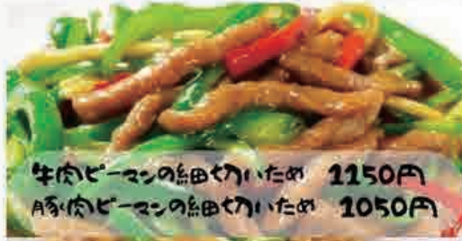
牛肉ビーマンの細切りいため 1150円 豚肉ビーマンの細切りいため 1050円