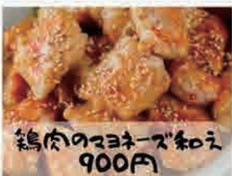
鶏肉のマヨネーズ和え 900円