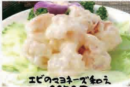
エビのマヨネーズ和え 1150円