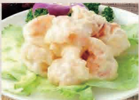
⑦エビマヨ定食 ¥950(税込)