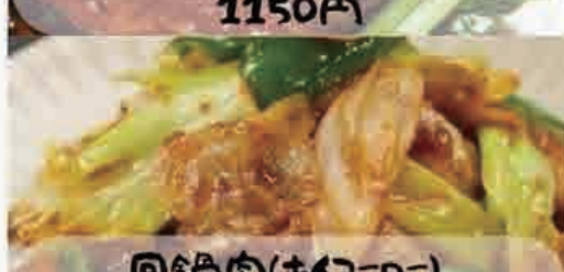
回鍋肉(ホイコーロ) 900円