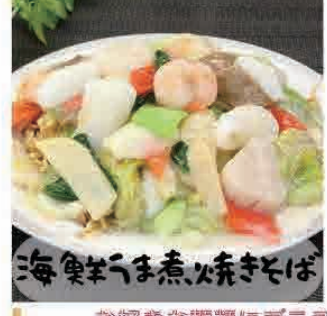
海鮮うま煮焼きそば