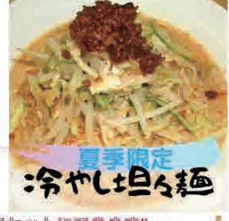
夏季限定 冷やし坦々麺