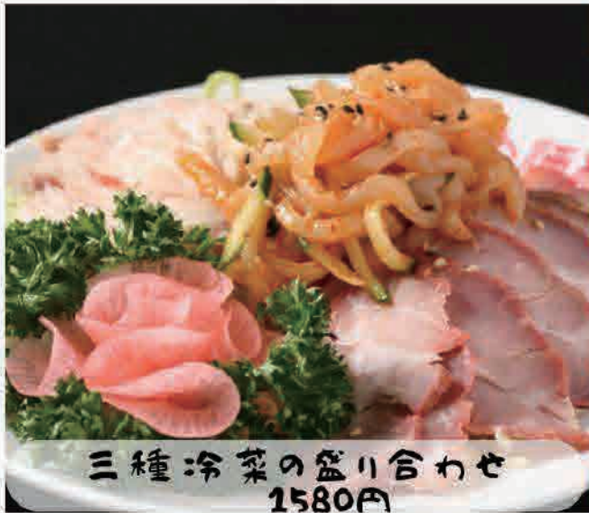
三種冷菜の盛り合わせ 1580円