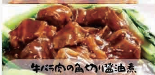
牛バラ肉の角切り醤油煮 1280円