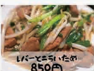
レバーとコーンいため 850円