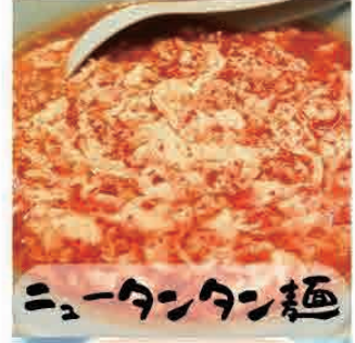
ニュータンタン麺