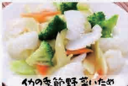
イカの季節野菜いため 950円