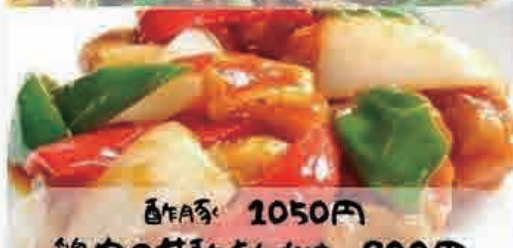
豚肉 1050円 鶏肉の甘酢あんかけ 900円