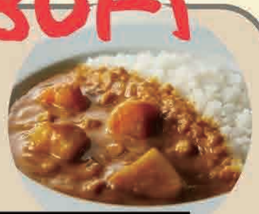
特製タンメン+半カレーセット 特製味噌タンメン+半カレーセット