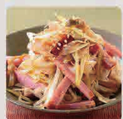
ネギチャーシュー