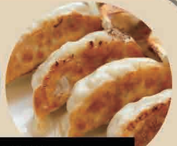
特製タンメン+半餃子セット 特製味噌タンメン+半餃子セット