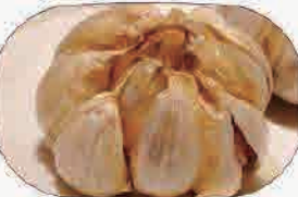
ニンニクの丸揚げ380円