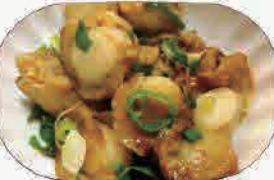
ベビーホタテのバター焼き小680円