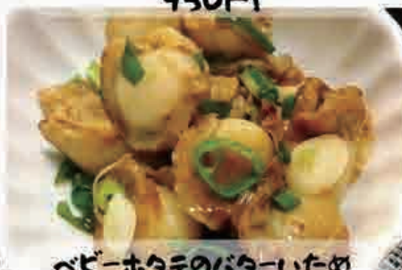
ベビーホタテのバターいため 1150円