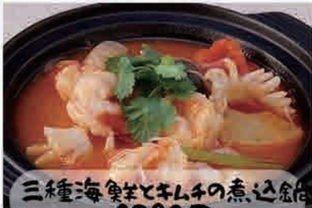
三種海鮮とキノコの煮込鍋 1380円