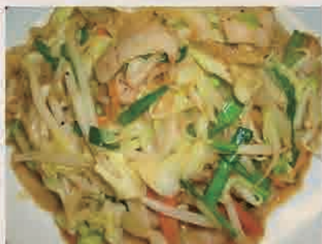
④肉野菜炒め定食 ¥850(税込)