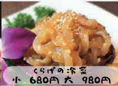
くらげの冷菜 小 680円 大 980円