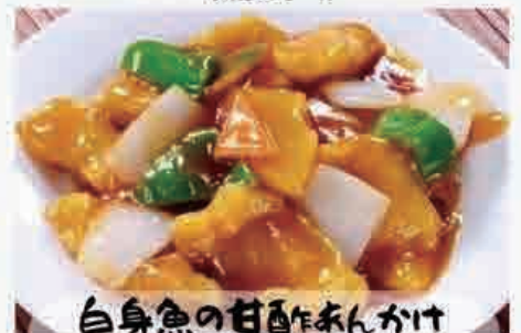
白身魚の甘酢あんかけ 980円