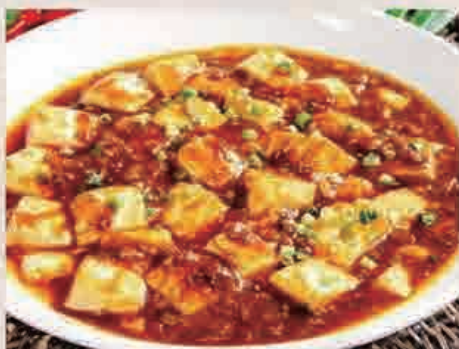
⑤麻婆豆腐定食 ¥850(税込)