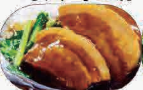
豚バラ醤油煮 小600円