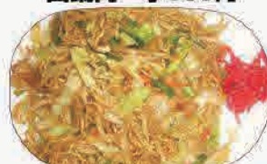
ソース焼きそば 小600円