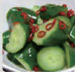
きゅうりのピリ辛和え