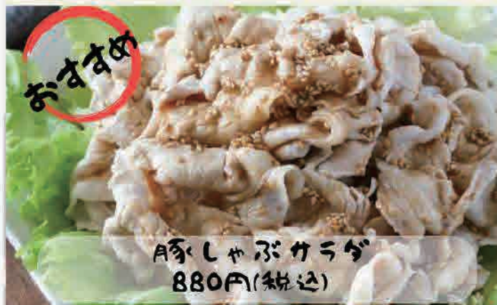
豚しゃぶカラダ 880円(税込)