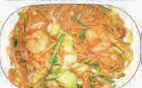
上海焼きそば 小600円