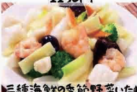
三種海鮮の季節野菜いため 1380円