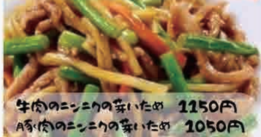
牛肉のニンニクの芽いため 1150円 豚肉のニンニクの芽いため 1050円