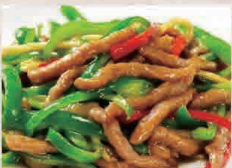
⑧青椒肉絲定食 ¥950(税込)