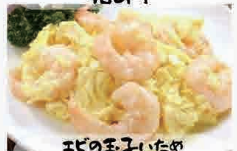
エビの玉子いため 980円