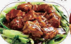
牛バラ醤油煮 小600円