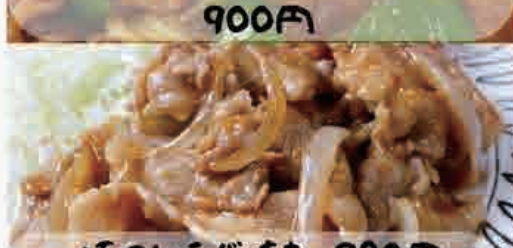
豚肉のしょうが焼き 980円 牛バラ焼き肉 1080円