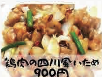
鶏肉の四川食いため 900円