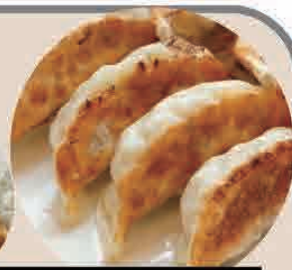
炒飯+半餃子セット カレー+半餃子セット 各880円