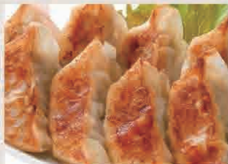
①焼き餃子定食 ¥780(税込)