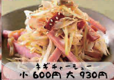
ネギチャーシュー 小 600円 大 930円