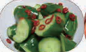
きゅうりのピリ辛和え380円