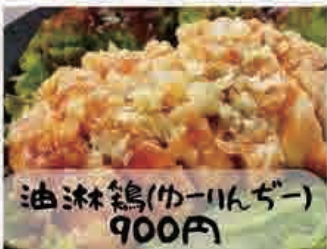
油淋鶏(カーリんダー) 900円