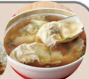
大盛炒飯+ワンタンスープセット 大盛カレー+ワンタンスープセット 各950円