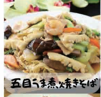
五目うま煮焼きそば