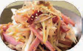
ネギチャーシュー600円