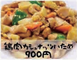
鶏肉カニコーンいため 900円