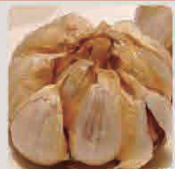
ニンニクの丸揚げ