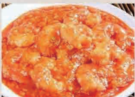
⑩エビチリ定食 ¥950(税込)