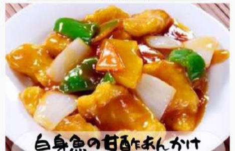
白身魚の甘酢あんかけ 980円