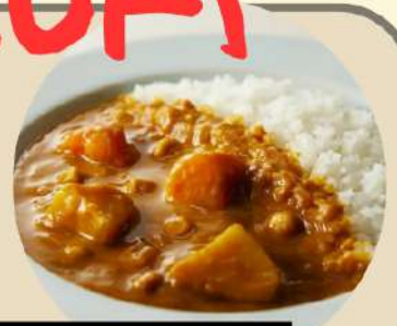
特製タンメン+半カレーセット 特製味噌タンメン+半カレーセット