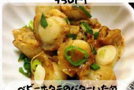
ベビーホタテのバターいため 1150円