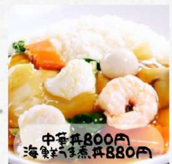
中華丼 800円 海鮮海鮮丼 880円