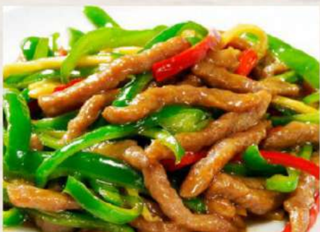
⑧青椒肉絲定食 ¥900(税込)