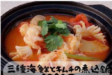
三種海鮮とキノコの煮込鍋 1380円