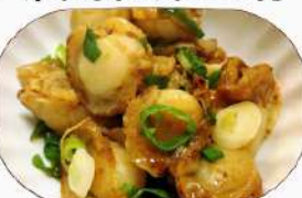
ベビーホタテのバター焼き小680円