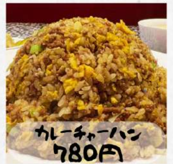
カレーチャーハン 780円