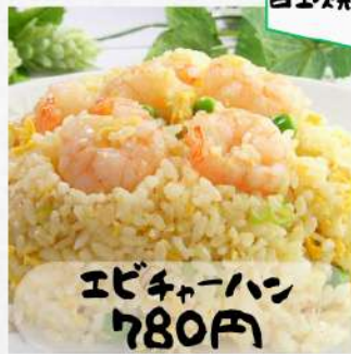
エビチャーハン 780円