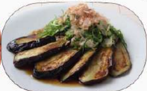
ナス焼きポン酢490円