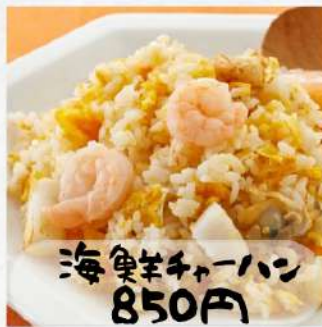
海鮮チャーハン 850円