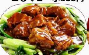
牛バラ醤油煮 小600円