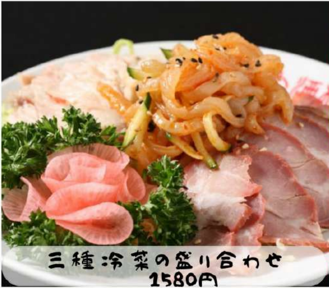
三種冷菜の盛り合わせ 1580円