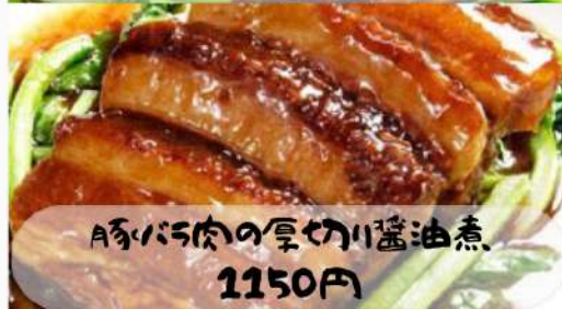
A豚バラ肉の厚切り醤油煮 1150円