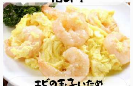
エビの玉子いため 980円