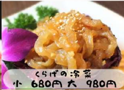
くらげの冷菜 小 680円 大 980円