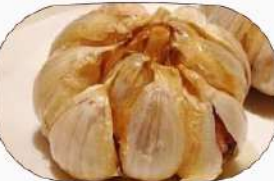
ニンニクの丸揚げ380円