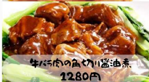
牛バラ肉の魚切り醤油煮 1280円