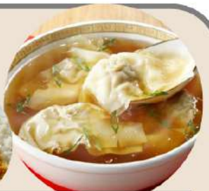
大盛炒飯+ワンタンスープセット 大盛カレー+ワンタンスープセット 各880円