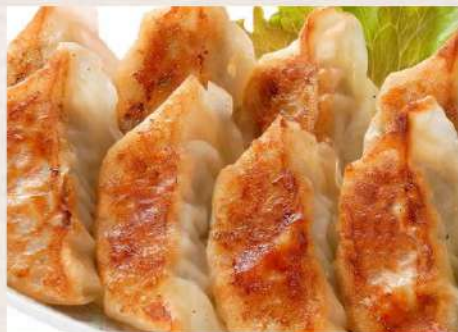
①焼き餃子定食 ¥680(税込)

※平日ランチ11:00~15:00迄ライスおかわり自由 (ディナー・土日祝日は+100円となります) ※写真はイメージです。