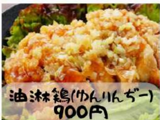
油淋鶏(ゆんりんぐー) 900円