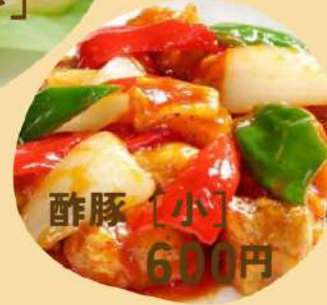
酢豚 [小] 600円