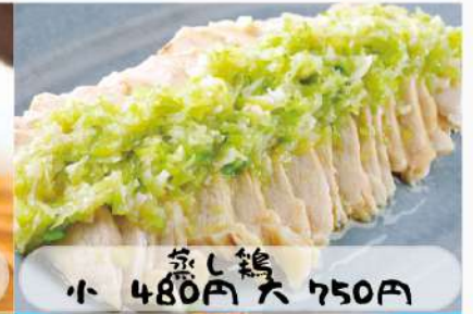
蒸し鶏 小 480円 大 750円