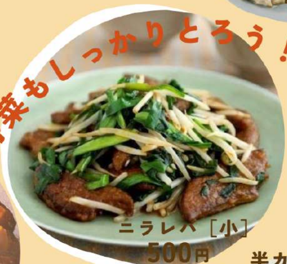
ニラレハ [小] 500円