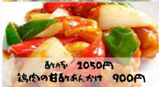
酢豚 1050円 鶏肉の甘酢あんかけ 900円