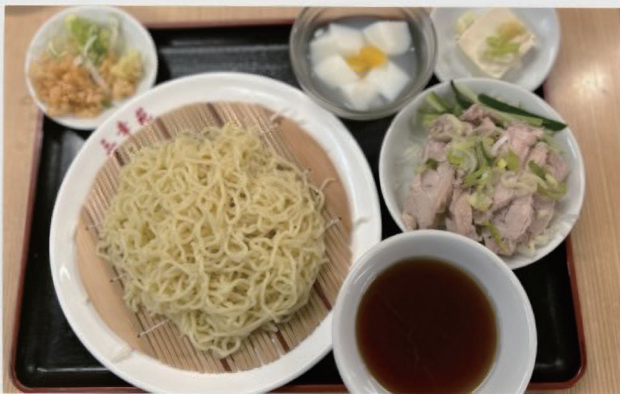
ざるラーメン+蒸し鶏定食 1,000円