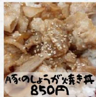
A豚のしょうが焼き丼 850円