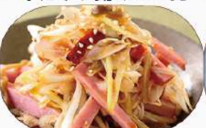
ネギチャーシュー600円