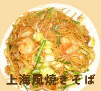
上海風焼きそば 600円