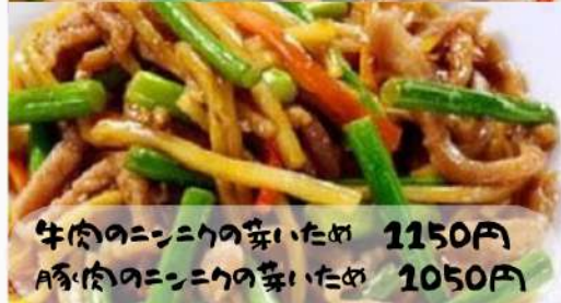
牛肉のニンニクの芽いため 1150円 A豚肉のニンニクの芽いため 1050円