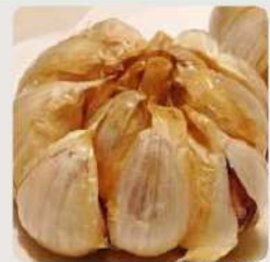
ニンニクの丸揚げ