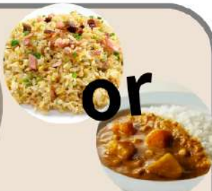
ラーメン+半炒飯セット ラーメン+半カレーセット 各850円