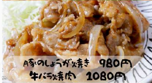
A豚のしょうが焼き 980円 牛バラ焼き肉 1080円