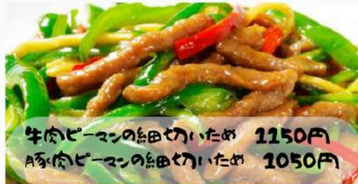
牛肉ビーマンの細切いため 1150円 A豚肉ビーマンの細切いため 1050円