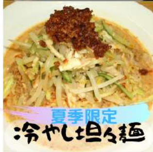
夏季限定 冷やし坦々麺