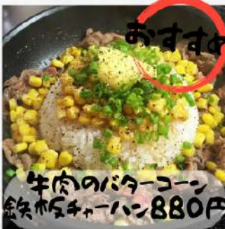
おすすめ 牛肉のバターコーン 海鮮チャーハン 880円