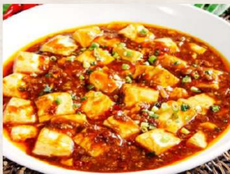
⑤麻婆豆腐定食 ¥800(税込)