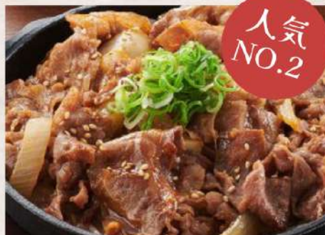
⑫牛バラ焼肉定食 ¥950(税込)