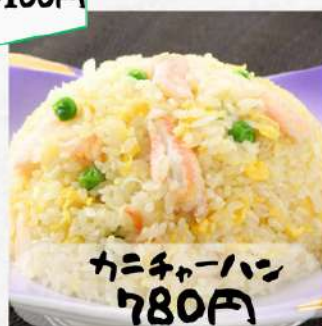
カニチャーハン 780円