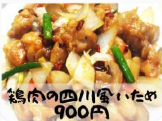
鶏肉の四川風いため 900円