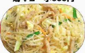
焼きビーフン 小600円