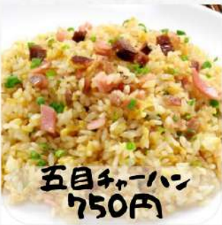
五目チャーハン 750円