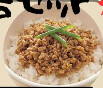
特製タンメン+半そぼろ丼セット 特製味噌タンメン+半そぼろ丼セット