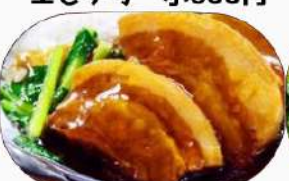
豚バラ醤油煮 小600円