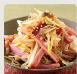
ネギチャーシュー