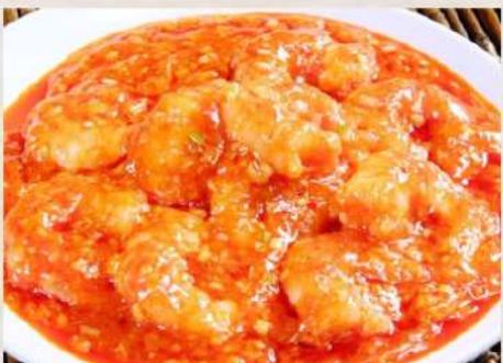
⑩エビチリ定食 ¥900(税込)