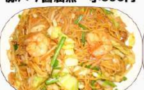
上海焼きそば 小600円