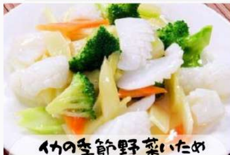
イカの季節野菜いため 950円