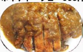
カレーとんかつ 600円