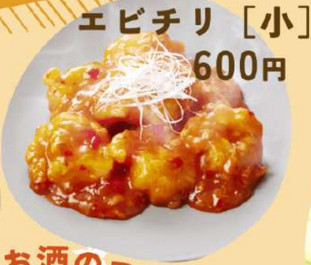
エビチリ [小] 600円