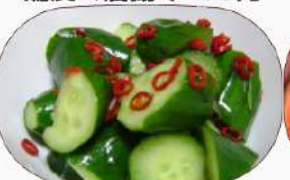
きゅうりのピリ辛和え380円