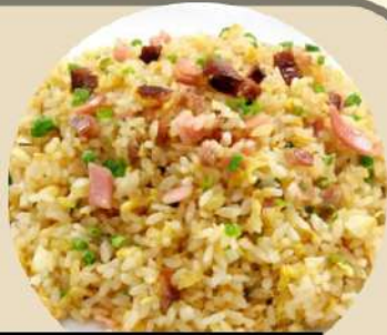
特製タンメン+半炒飯セット 特製味噌タンメン+半炒飯セット