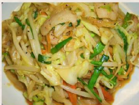
④肉野菜炒め定食 ¥800(税込)