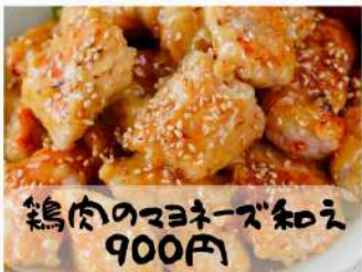
鶏肉のマヨネーズ和え 900円