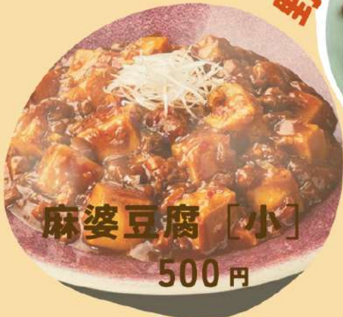
麻婆豆腐 [小] 500円