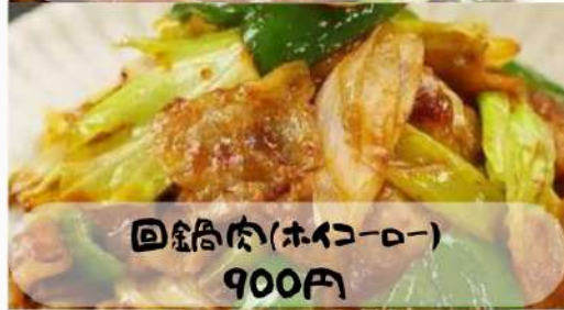
回鍋肉(ホイコーロ) 900円