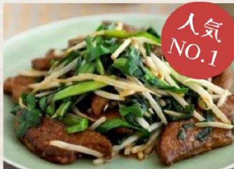
②ニラレバ定食 ¥800(税込)