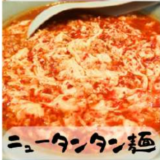
ニュータンタン麺