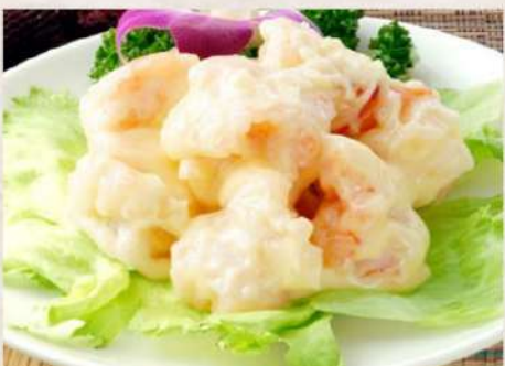
⑦エビマヨ定食 ¥900(税込)