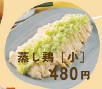
蒸し鶏 [小] 480円