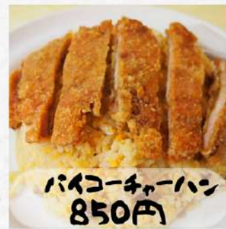
バイコチャーハン 850円