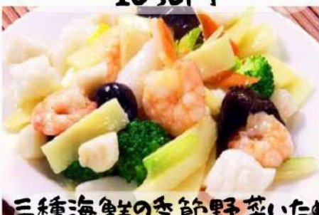
三種海鮮の季節野菜いため 1380円