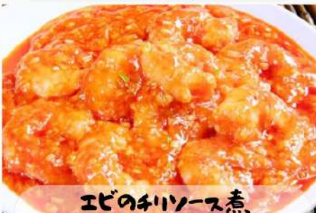
エビのチリソース煮 1050円