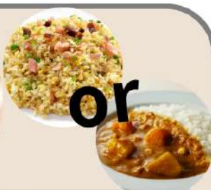
ネギラーメン+炒飯セット ネギラーメン+カレーセット 各1000円