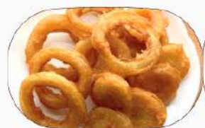
オニオンリング揚げ380円