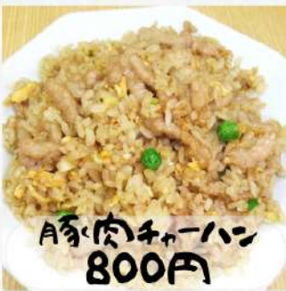
A豚肉チャーハン 800円