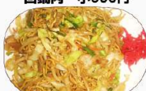
ソース焼きそば 小600円