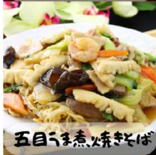
五目チャーシュー焼そば