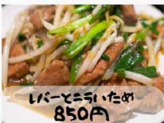
レバーとニラいため 850円