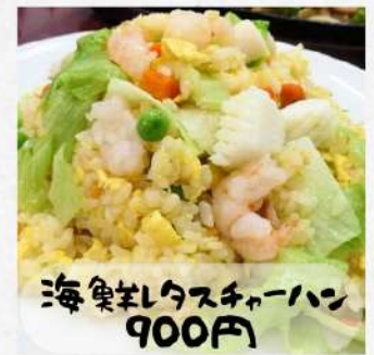
海鮮レタスチャーハン 900円