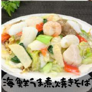
海鮮チャーシュー焼そば