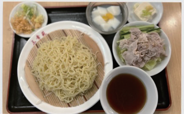
ざるラーメン+豚しゃぶサラダ定食 1,000円