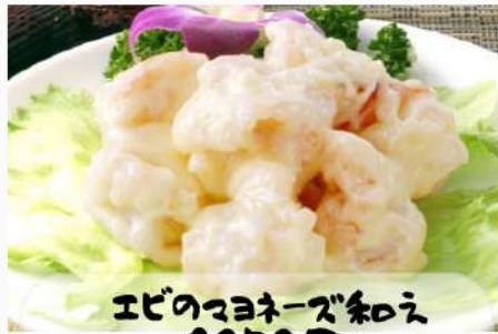
エビのマヨネーズ和え 1050円