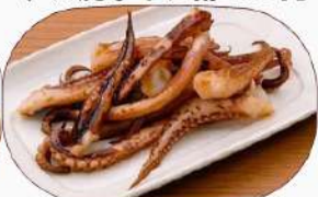
イカゲソのバター焼き490円