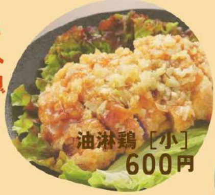
油淋鶏 [小] 600円