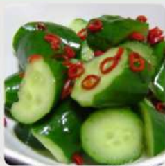
きゅうりのピリ辛和え