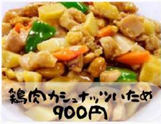
鶏肉カニサツッいため 900円