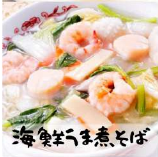
海鮮チャーシューそば