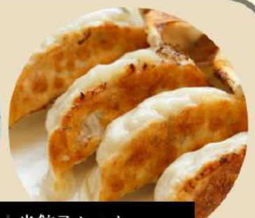
特製タンメン+半餃子セット 特製味噌タンメン+半餃子セット