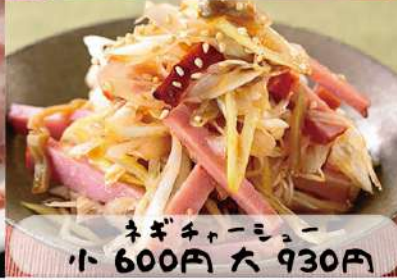
ネギチャーシュー 小 600円 大 930円