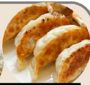
炒飯+半餃子セット カレー+半餃子セット 各850円