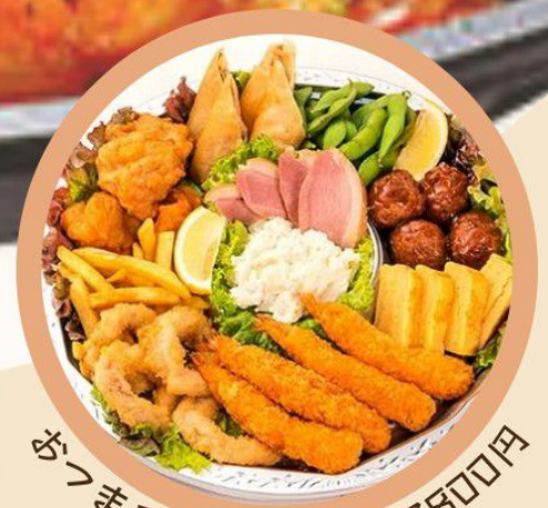
おつまみオードブル 3800円